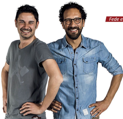
Fede e Tinto

A cura della Camera di Commercio di Ascoli Piceno